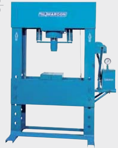
* com prensa auxiliar de 15 ton