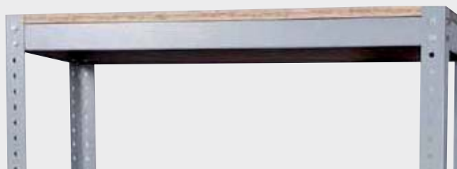
Sistema com parafusos

ref.: PT-4 C | L | H | K 1005 | 405 | 2005 | 2000*