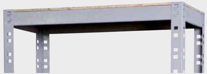
Sistema de encaixe

ref.: PDP-4 C L H K 805 405 1970 400* * distribuídos